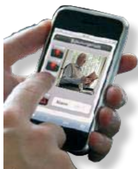
Handy für Kommunikation mit Bild