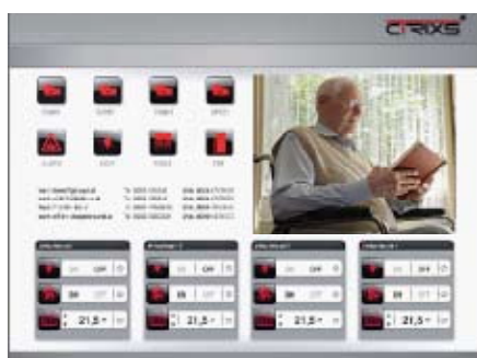
Butlergrafik mit Kamerafenster

Umfragen bestätigen es immer wieder: der überwiegende Teil der über 50jährigen will möglichst lange eigenständig in seiner vertrauten Umgebung in der eigenen (Miet-) Wohnung oder in seinem Haus leben. Für ein erfolgreiches und möglichst langes selbständiges Wohnen ist es notwendig, sich auf die nachberufliche Phase des Lebens vorzubereiten. Nicht nur mental sondern auch praktisch, d.h. Unterstützung durch Technik. Technik, die uns hilft das Alter erfolgreich zu bewältigen. Viele Ältere wünschen sich im Bedarfsfall von den Kindern betreut zu werden. Eine praktische Hilfe bietet das Verbundensein mit seiner Familie. Das ermöglicht I H N E N, der Senior Butler von cTrixx